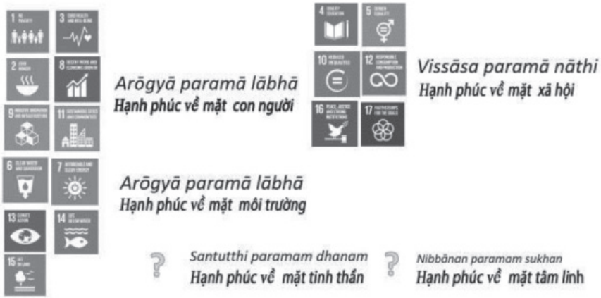
Hình 03: Kết hợp SDGs (Mục tiêu phát triển bền vững) vào bố cục mới

Một trong những phát hiện khác của bài nghiên cứu này là các Mục tiêu Phát triển Bền vững (SDGs) chỉ đề cập đến hai khía cạnh theo khuôn khổ trên. Như hình 03 minh họa, có một khoảng cách lớn giữa hạnh phúc về tinh thần và tâm linh trong SDGs. So với các khía cạnh khác của hạnh phúc, 11 trong số 17 mục tiêu phát triển được xây dựng chỉ tập trung vào hạnh phúc của con người và môi trường trong khi phần còn lại được hướng đến hạnh phúc về mặt xã hội. Do đó, bài viết này chuyển đến một phát hiện đáng kể về việc thiếu đi hai khía cạnh khác của hạnh phúc trong các Mục tiêu Phát triển Bền vững (SDGs).